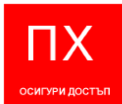
Знак "Пожарен хидрант"

Знаците за обозначаване на пожарни хидранти и пожарни водоеми имат правоъгълна или квадратна форма и бяла пиктограма на червен фон. Червената част трябва да покрива най-малко 50 % от повърхността на знака.